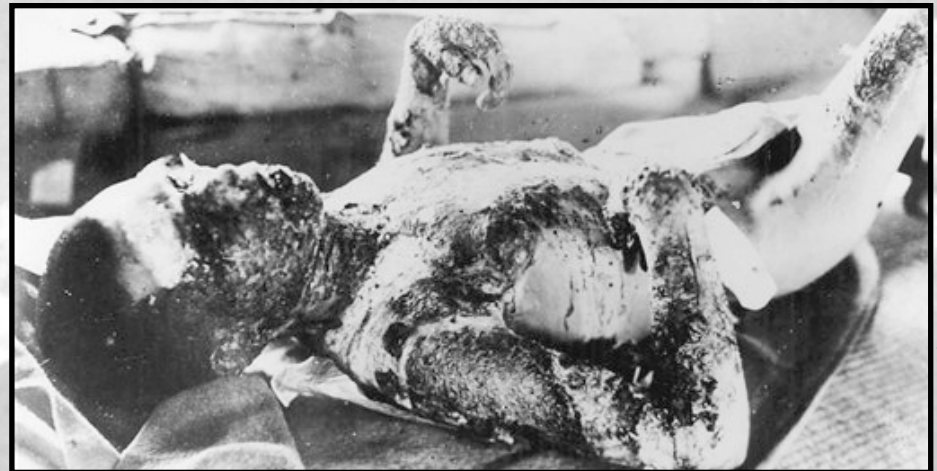
Víctima del bombardeo atómico de Hiroshima, 7 de agosto de 1945.