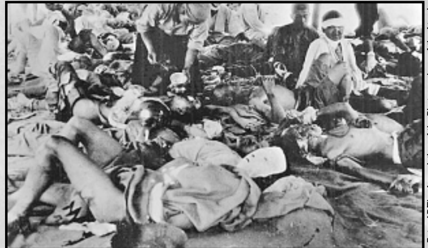
Víctimas del bombardeo atómico de Hiroshima, 7 de agosto de 1945.

"Hiroshima, Nagasaki... ¿y Teherán?" Del Servicio Noticioso Un Mundo que Ganar. Ver artículo en la página 15 de este número.