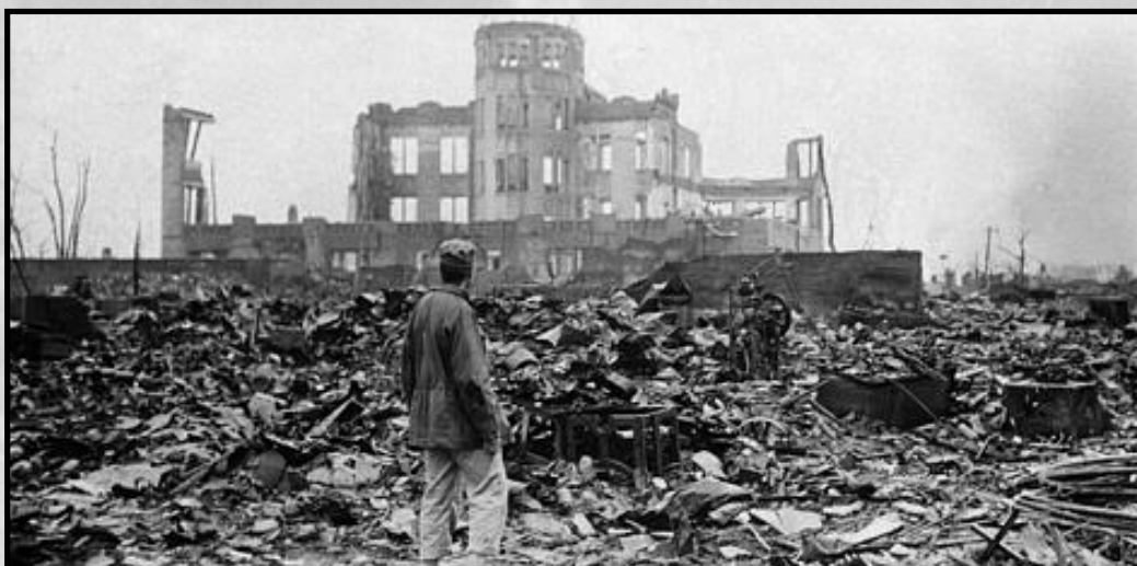
Hiroshima, un mes después del ataque.