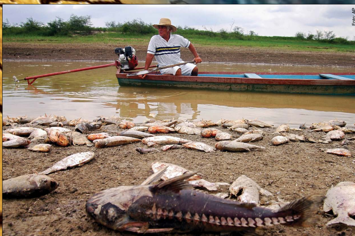
Un hombre observa los peces muertos a la orilla del lago Rai cerca del pueblo de Careiro da Varzea, Brasil. En 2005, el nivel del agua del río Amazonas cayó unos pies debido a una sequía de varios meses de duración. En 2009, las comunidades a lo largo del río levantaron nuevos pisos para sus casas construidas sobre pilotes a fin de tratarse de mantenerse por encima de las crecidas.