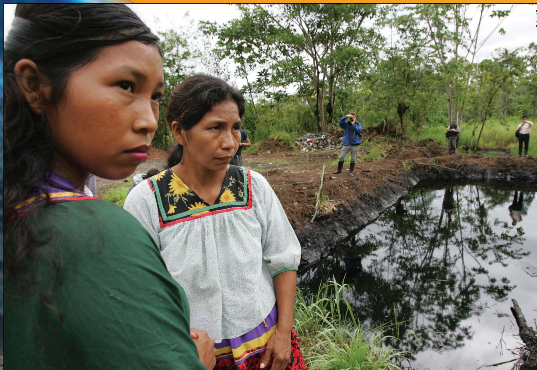
Unas indígenas cofanas paradas cerca de una laguna de petróleo en la región amazónica ecuatoriana, que los ambientales llaman un Chernobil amazónico debido al lento envenenamiento de una extensión de la selva tropical del tamaño del estado gringo de Rhode Island por millones de galones de petróleo y miles de millones de galones más de aguas negras tóxicas.

Si usted quiere un mundo donde las personas vivan y florezcan... donde actuemos juntos como guardianes del globo... donde preservemos y realcemos el mundo salvaje y natural... enchúfese con esta revolución y difúndala ahora mismo. El propio destino del planeta y de la humanidad está en juego... y tenemos un mundo entero que ganar.