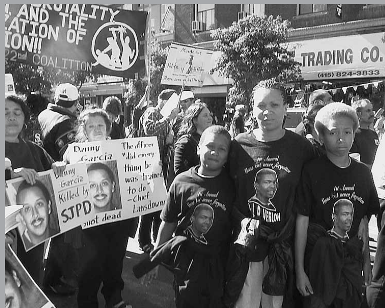
Especial para Revolución