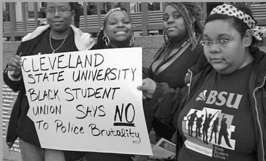
Especial para Revolución