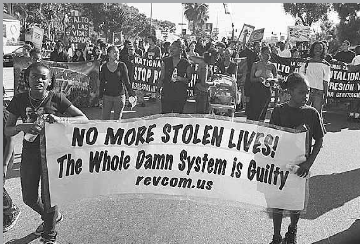
Especial para Revolución