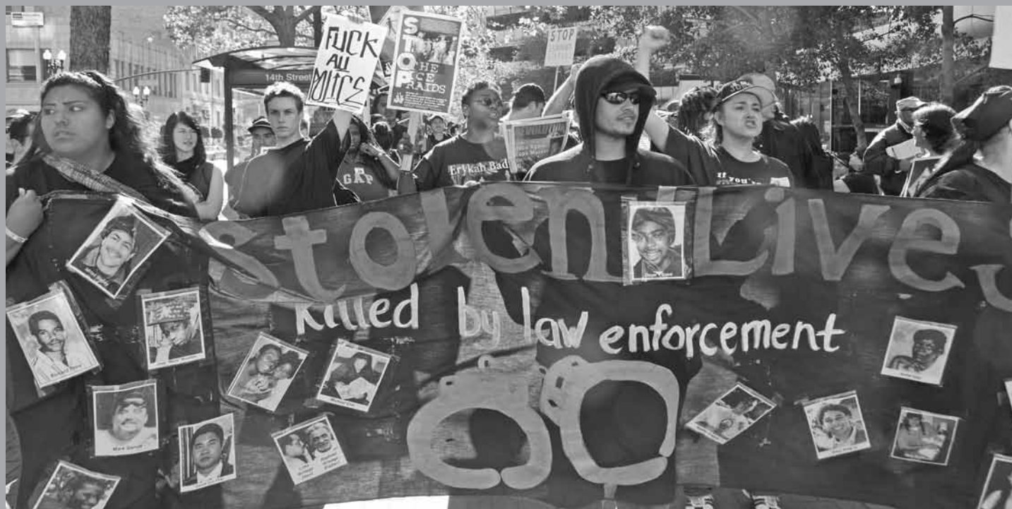
Especial para Revolución

El 22 de octubre de 2012 se cumple el 17º año en que las personas se han tomado las calles en ciudades por todo Estados Unidos con motivo del Día Nacional de Protesta para Parar la Brutalidad Policial, la Represión y la Criminalización de una Generación. En estas páginas presentamos unas fotos de las actividades del 22 de octubre de años anteriores.