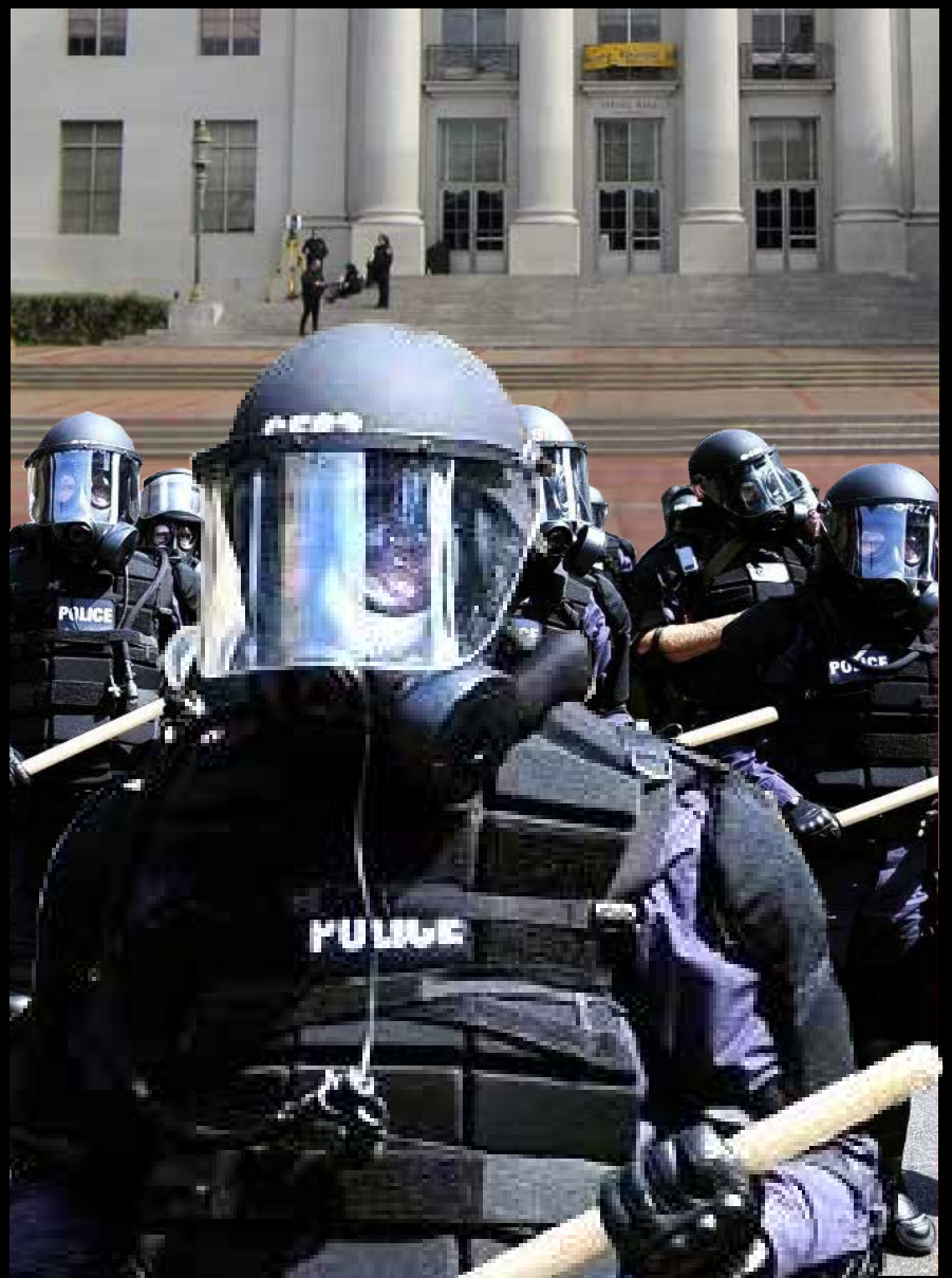
Los planes de la rectora Christ para un “Año de la Libertad de Expresión” 2017